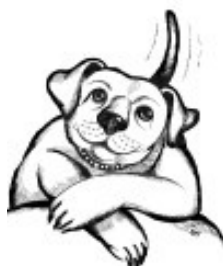
Abbildung 1: Fridolin, das Maskottchen des Reuter-Rudels

Der Verein war Partner des Projektes „Reuter-Rudel“, dass im April zusammen mit der Firma Umweltconsulting Dr. Hoffmann ins Leben gerufen wurde. Mit Unterstützung des Quartiersmanagements im Reuterquartier wurde das Projekt aus Mitteln des Programms „Soziale Stadt“ finanziert. Das Fördervolumen betrug rd. € 10'000. Ziel des Projektes war, die Gemeinschaft der Hundehalter/innen in Nordneukölln zu stärken und zu verantwortlicherem Handeln zu aktivieren. Mit dem Projekt sollte auch ein Zeichen gesetzt werden, dass sich Hundehalter/innen und Nicht-Hundehalter/innen gemeinsam für einen sauberen Kiez engagieren. Die einzelne Tätigkeitsfelder