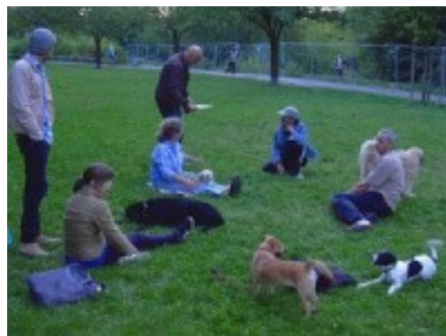
Abbildung 2: Treffen des Reuter-Rudels