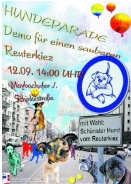
Abbildung 3: Postkarte und Plakat für die Hundeparade

Am 10. Juli 2009 war der Verein zusammen mit Umweltconsulting Dr. Hoffmann mit einem Infostand Gast auf dem Kiezfest in der Rütlistraße. Dort haben wir unter anderem über die Hundekotbeutelspender und die Aktivitäten des Reuter-Rudels informiert.