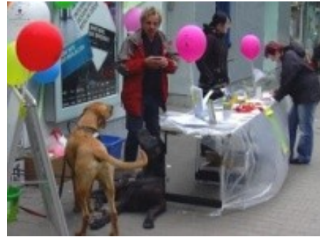
Abbildung 5: Unterschriftensammlung mit der Tiertafel vor den Treptower Festtagen

Auf der Mitgliederversammlung am 2. Juli 2009 hat der Verwaltungsrat die Gründung der Arbeitsgruppe Grunewald beschlossen. Anlass der Gründung waren einige Berichte in den Medien, die Sanktionen gegen Hundehalter im Auslaufgebiet andeuteten, vor allem aber auch der ab Ende Mai neu gezogene Zaun um einen Teil des Uferbereichs am Grunewaldsee. Diese Maßnahmen führten zu großem Unmut unter den Hundehalterinnen und Hundehaltern.