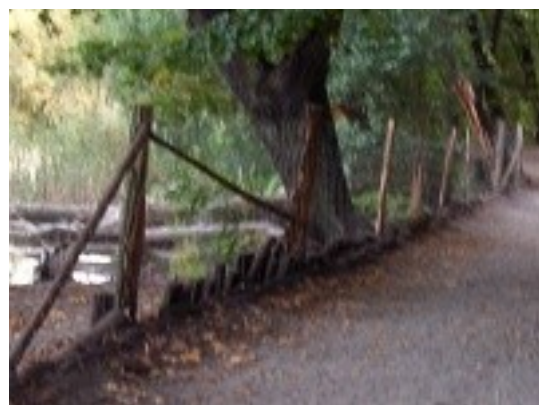
Abbildung 6: Der neue Zaun am Ufer des Grunewaldsees